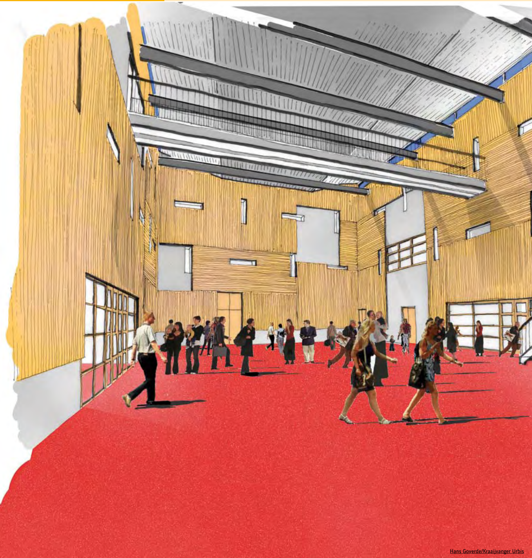
Hans Goverde/Kraaijvanger Urbis

en maatschappij. Ook is er een algemeen gebied, een instructieruimte en zijn er docentenwerkplekken. Naast de leerpleinen zijn er voor de AVO afdelingen gemeenschappelijke specifieke ruimten (specials), zoals studio's, het media-/documentatiecentrum, het laboratorium en het atelier. Leerlingen hebben geen vaste werkplek, ze kiezen een plek afhankelijk van de werkvorm en de benodigde middelen en bronnen. Ook de docenten hebben geen eigen vaklokaal meer, ze zijn afhankelijk van de gekozen werkvorm aanwezig in algemene en specifieke ruimten.