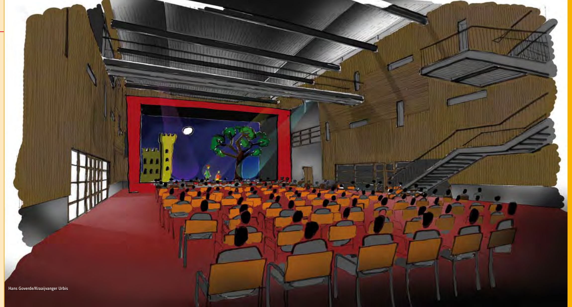
Hans Goverde/Kraaijvanger Urbis

Er komt een divers en kleurrijk programma in het kader van kunst en cultuur, wat door jongeren zelf samengesteld is. De Schoor wil bewoners graag ruimte voor ontmoeting bieden in een theatercafé in het nieuwe gebouw. Ook wil De Schoor een plek realiseren voor jeugdwerk en cursussen voor jong en oud aanbieden. Er zijn plannen om samen cursussen te ontwikkelen, die door leerlingen van De Meergronden gegeven worden aan bezoekers van De Schoor. Ook kunnen leerlingen het café bemannen en workshops volgen die bezoekers van De Schoor verzorgen. Een win-win-situatie dus.