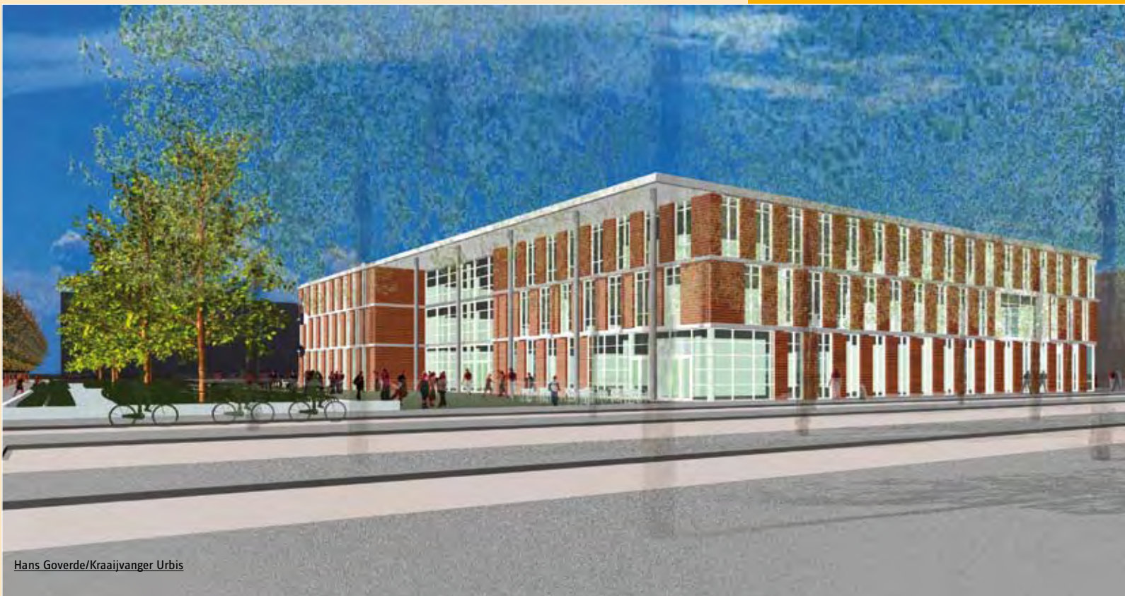
Hans Goverde/Kraaijvanger Urbis

In Almere Poort komt een school voor voortgezet onderwijs, geïnspireerd op het thema theater. M3V Adviespartners is door de directie van de Openbare Scholengemeenschap De Meergronden gevraagd om een contextrijk huisvestingsconcept te ontwikkelen, op basis van een vernieuwende onderwijsvisie. Een nieuw gebouw waarin ook een theatercafé komt van Stichting De Schoor, welzijnswerk Almere. Het thema theater loopt als een rode draad door het onderwijs en het nieuwe schoolgebouw.