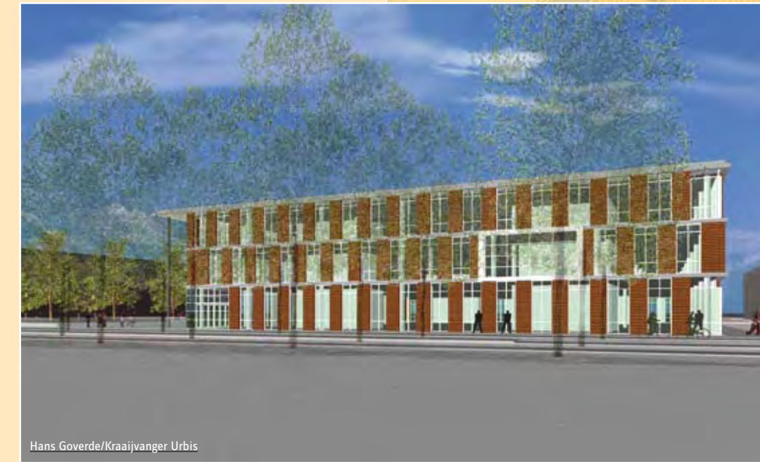
Hans Goverde/Kraaijvanger Urbis

Het thema theater biedt de school de mogelijkheid om een belangrijk deel van het onderwijs in de bovenbouw van het VMBO plaats te laten vinden aan de hand van projecten in de praktijkomgeving. Hiervoor worden 6 oefenbedrijven gerealiseerd: dit zijn grafimedia, licht & geluid en decorbouw, kap & grime, facilitair/gezondheid en podiumkunsten.